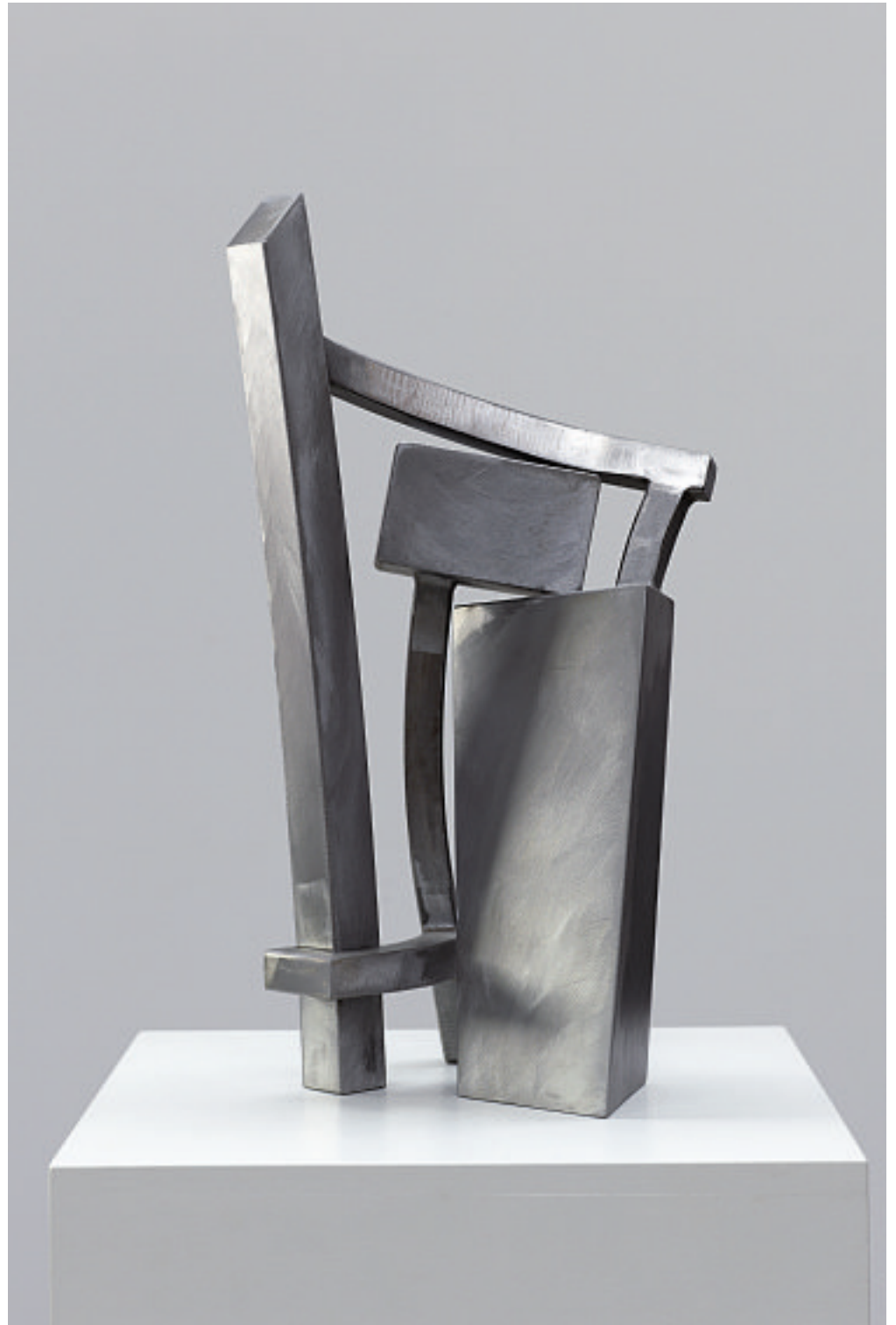
SOMEHOW STANDING, 2008