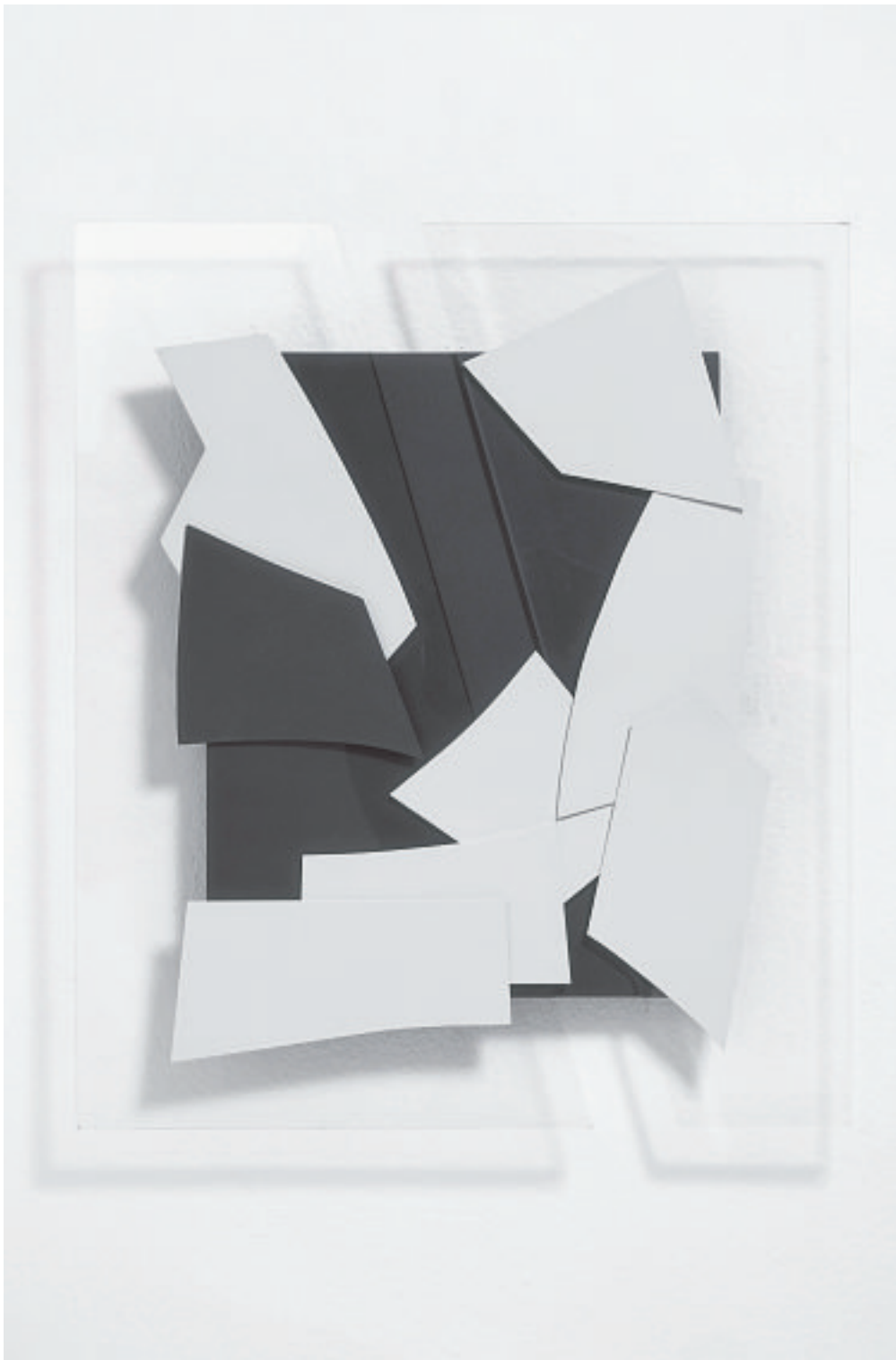
IMPROMPTU II, 2001

Stahllcollage / schwarzer Grund Stahl, verzinkt, bemalt, Acrylglas 105 x 90 x 5