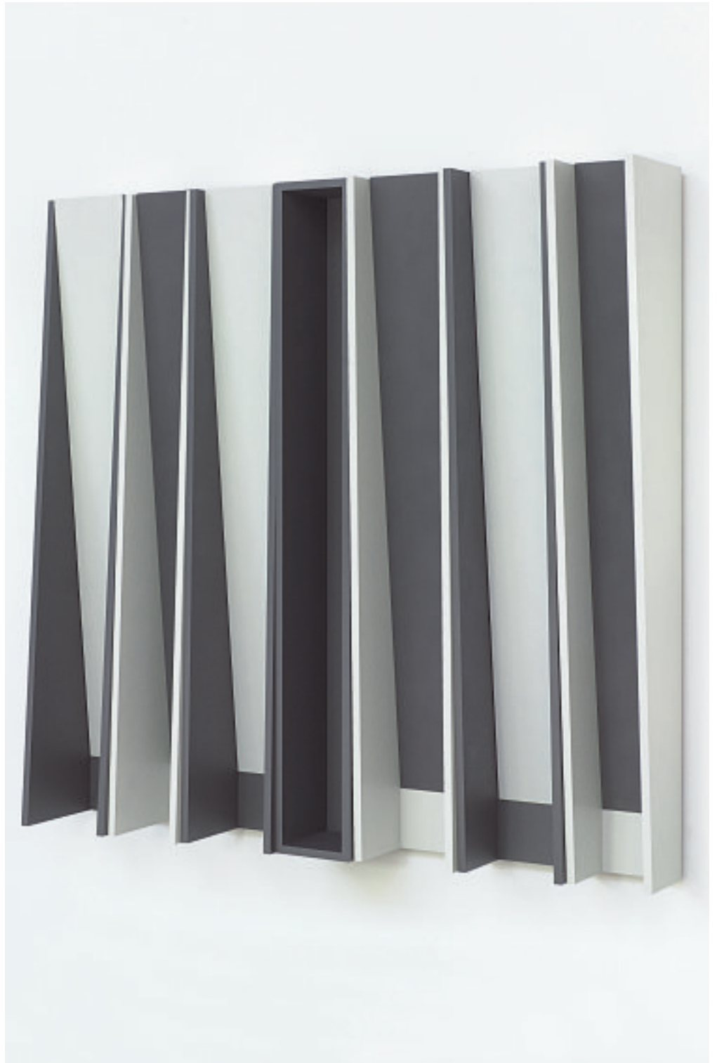
OHNE MITTE III, 2010

Holz (Mdf) bemalt, Stahl bemalt 175 x 183 x 32