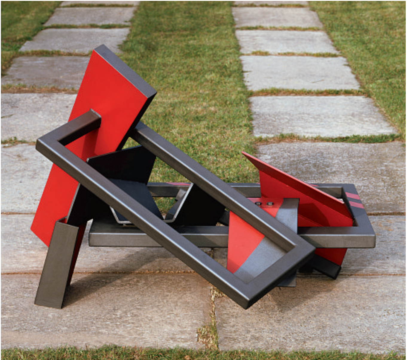
LA DESSERT, 1991