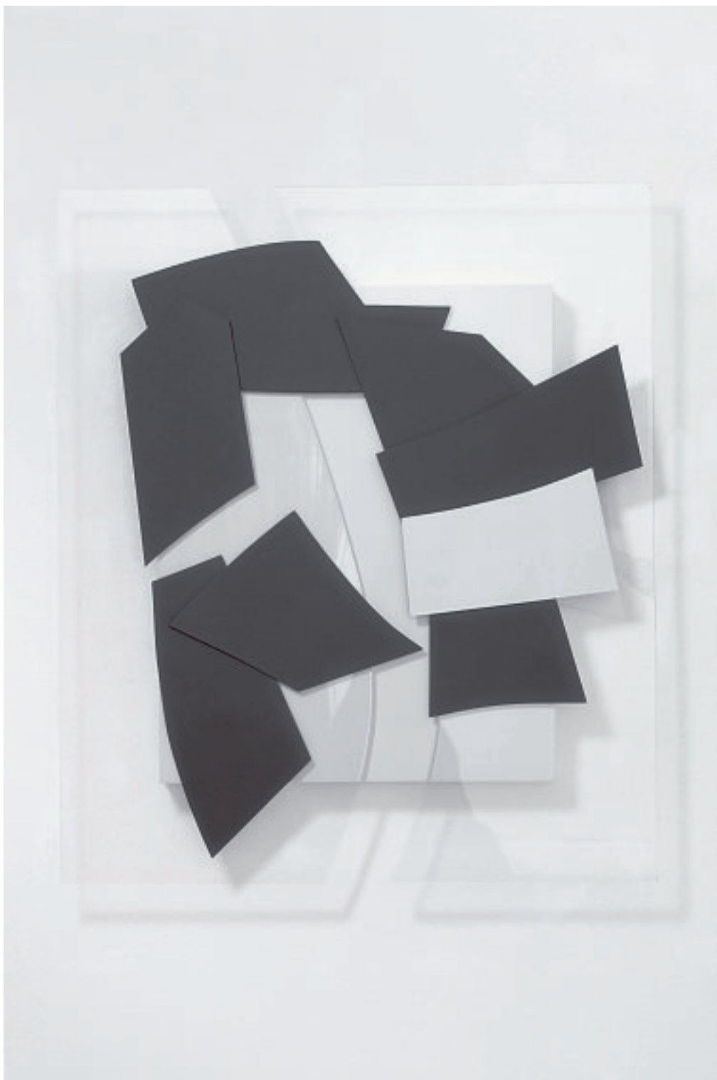
IMPROMPTU III, 2001

Stahllcollage / weißer Grund Stahl, verzinkt, bemalt, Acrylglas 105 x 90 x 5