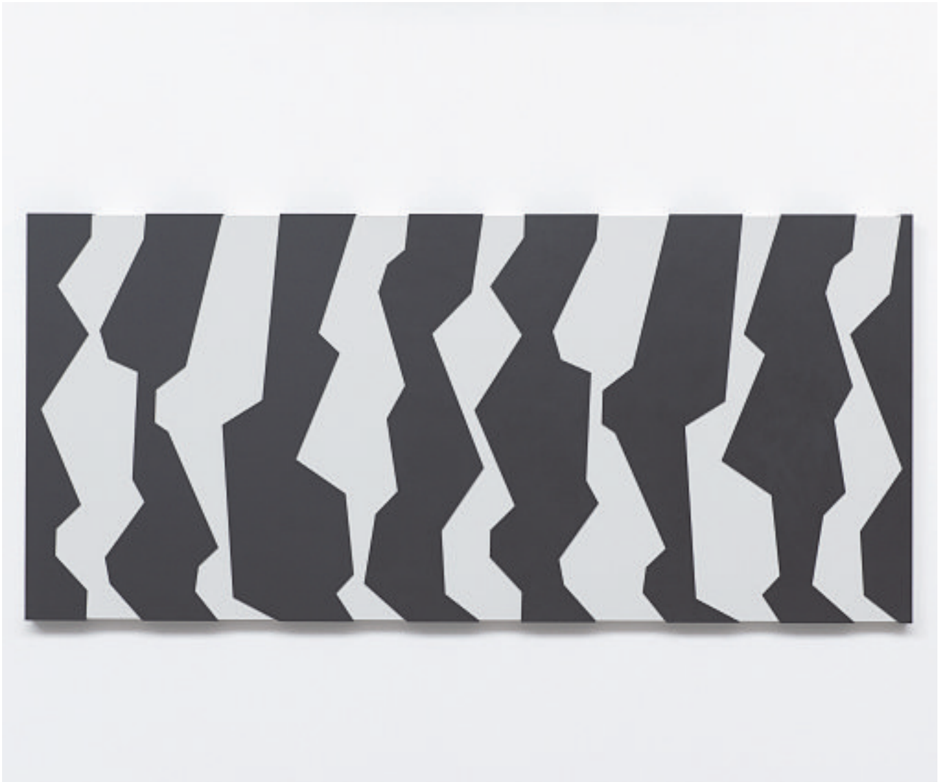
SCHATTEN II, 2006 (Acrylform-schwarz auf weißem Grund)

Mdf-Kästen, Acryl, farbig 130 x 285 x 7,5