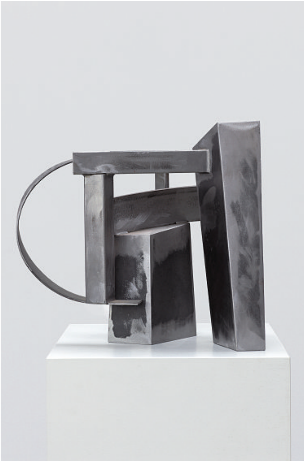
ROUND ABOUT, 2008