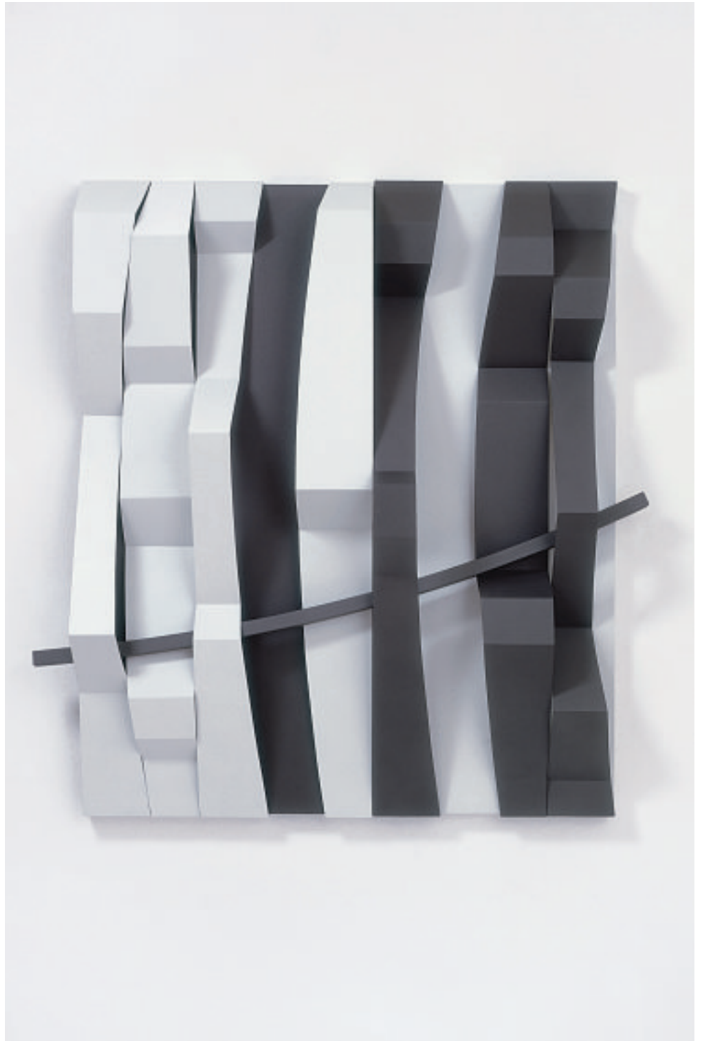
STACCATO I, 2001