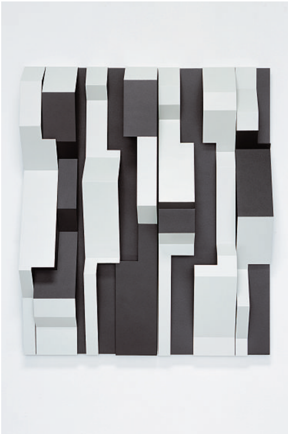
STACCATO III, 2005

Stahl, verzinkt, bemalt 130 x 110 x 28,5