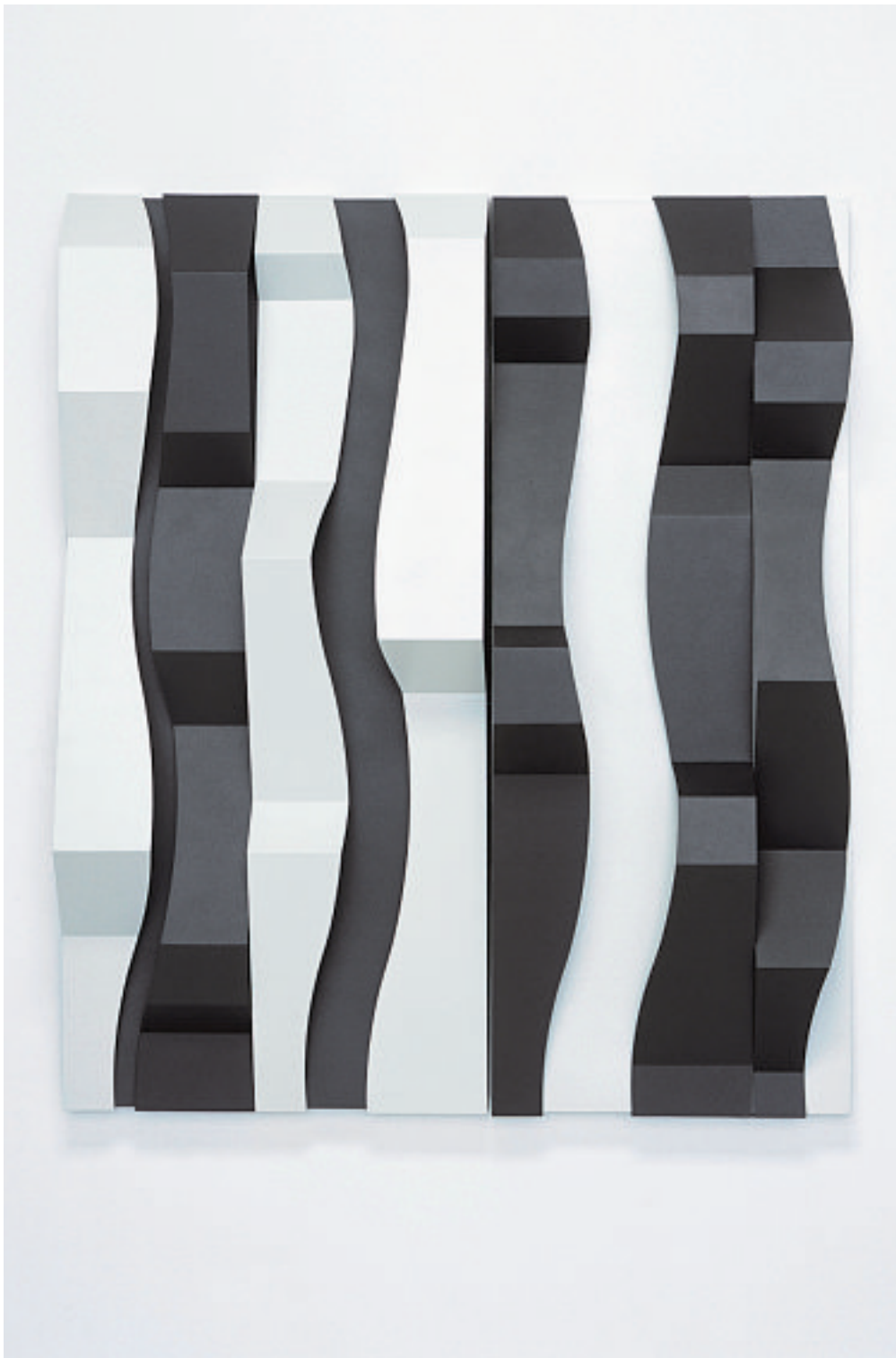
STACCATO II, 2005