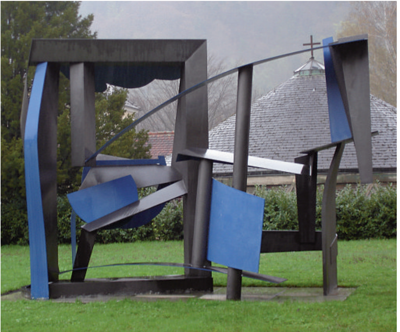
DAS FENSTER IM FREIEN, 1990 Skulpturenpark Heidelberg Leihgabe der Kunsthalle Mannheim