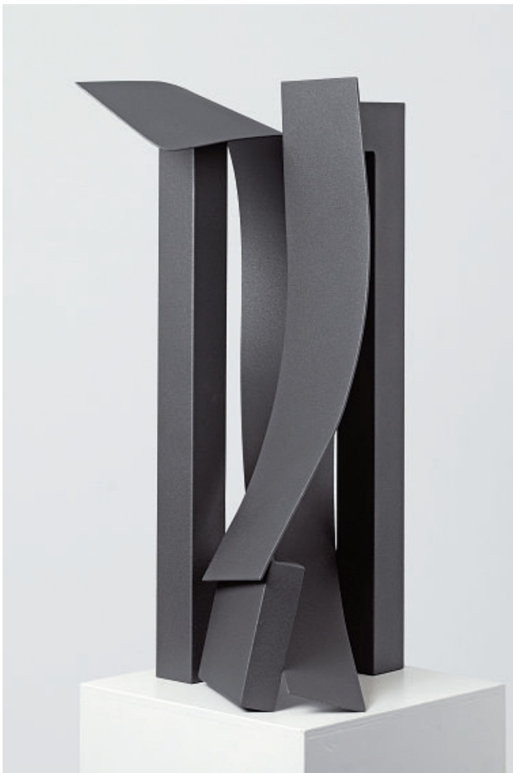
BETWEEN, 2006 Privatsammlung