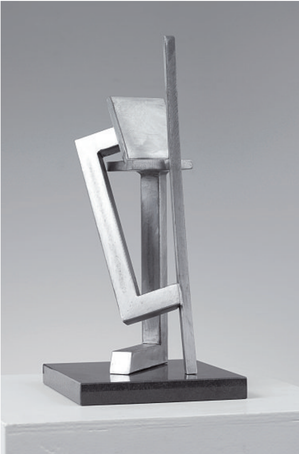
ON TOP, 2006

Stahl, Zaponlack matt, Granitsockel 30 x 11 x 11