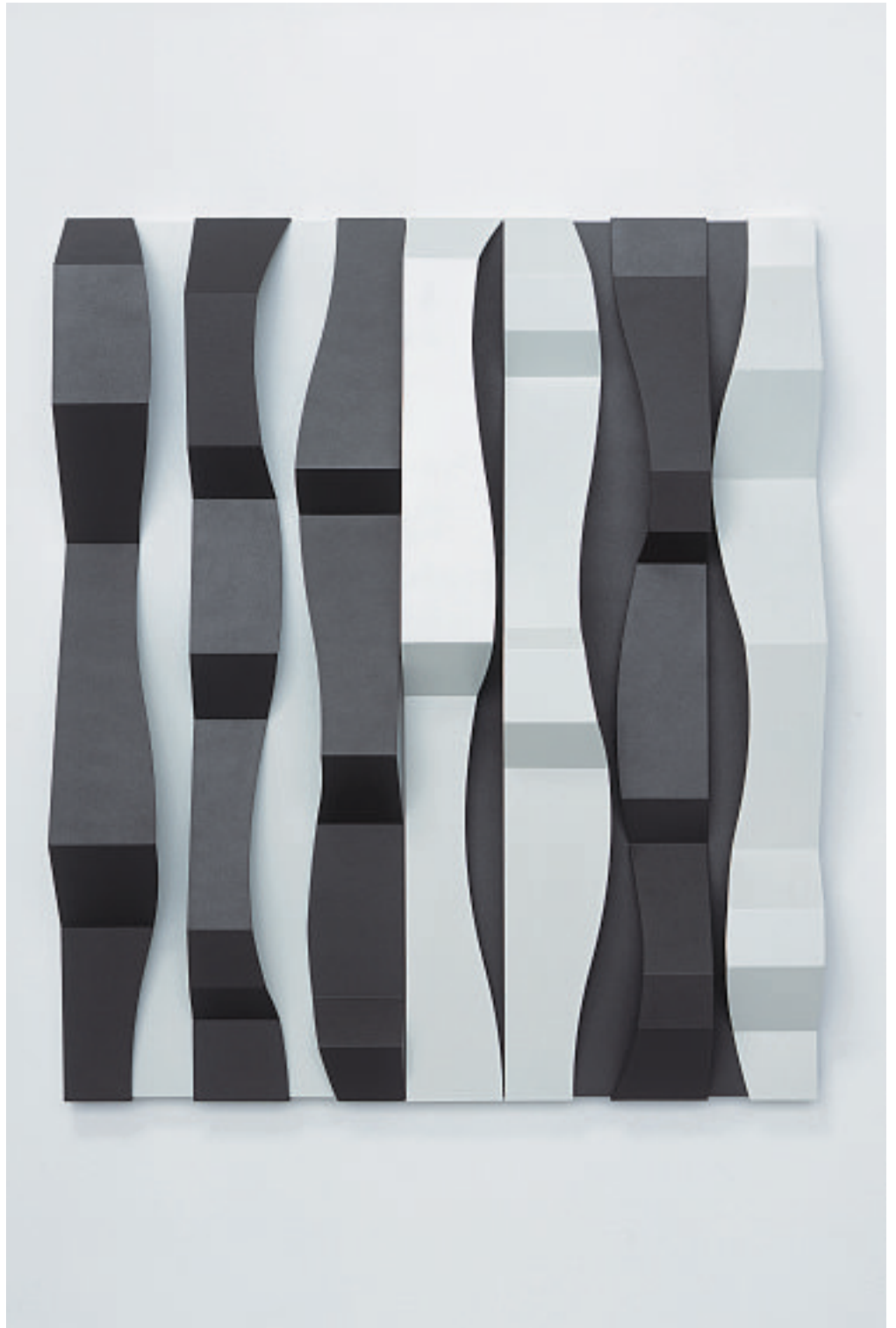
STACCATO IV, 2005