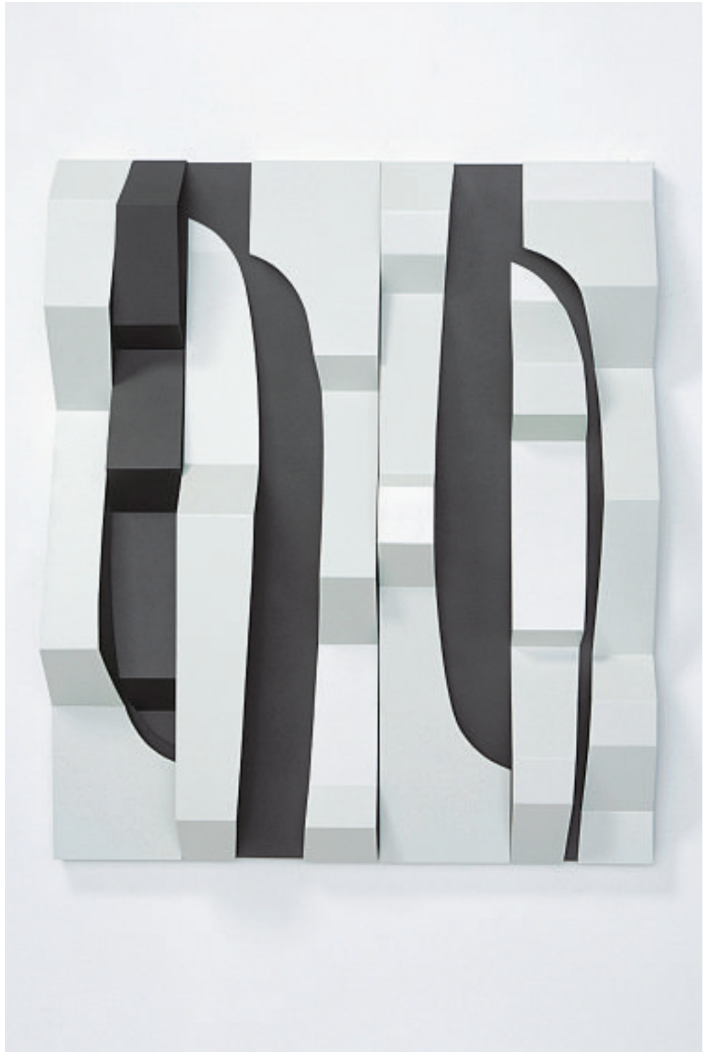
STACCATO V, 2005

Stahl, verzinkt, bemalt 130 x 110 x 23,5