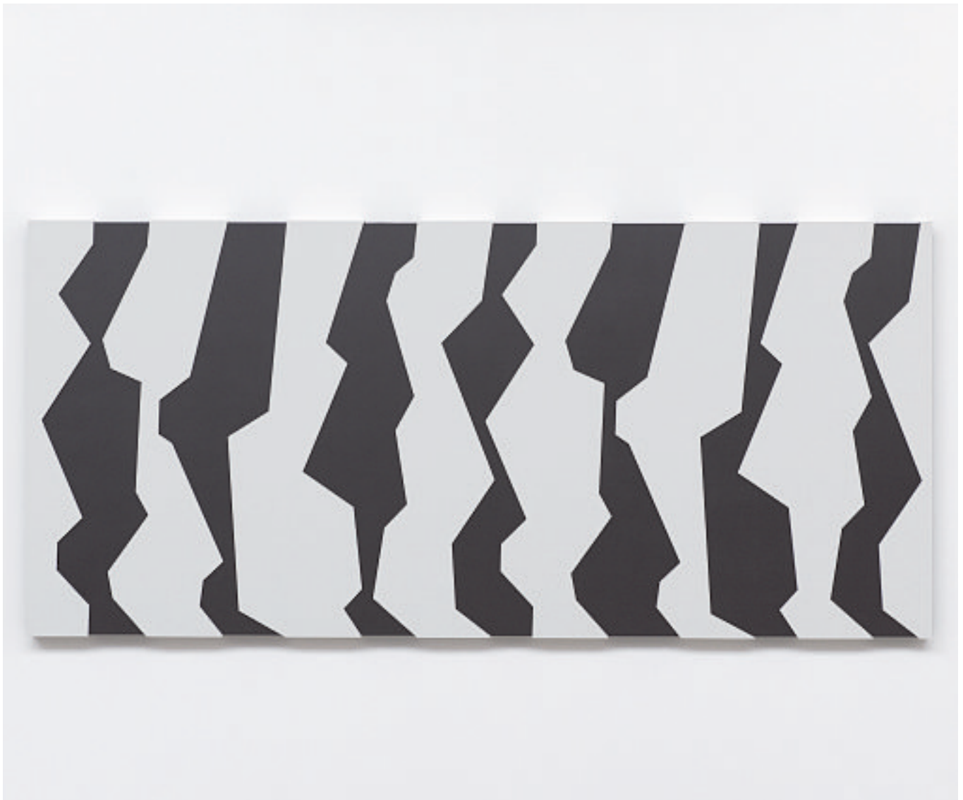
SCHATTEN I, 2006 (Acrylform-weiß auf schwarzem Grund)

4 Mdf-Kästen, Acryl, farbig 130 x 285 x 7,5