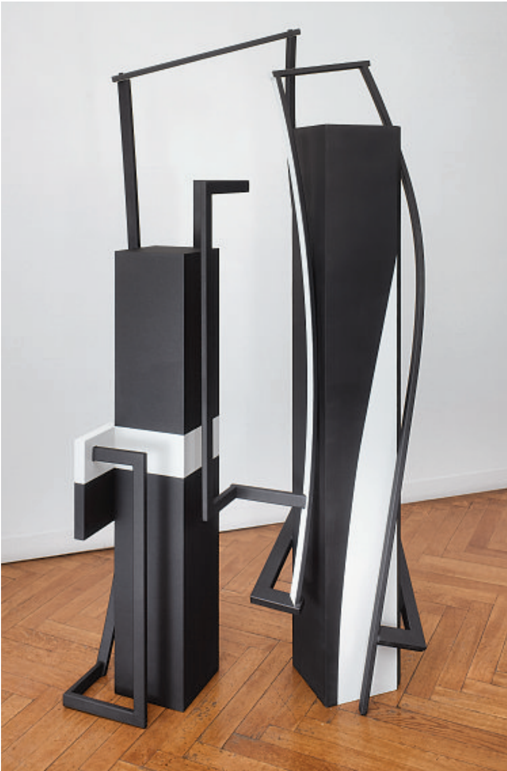
ENTRE DEUX, 1999