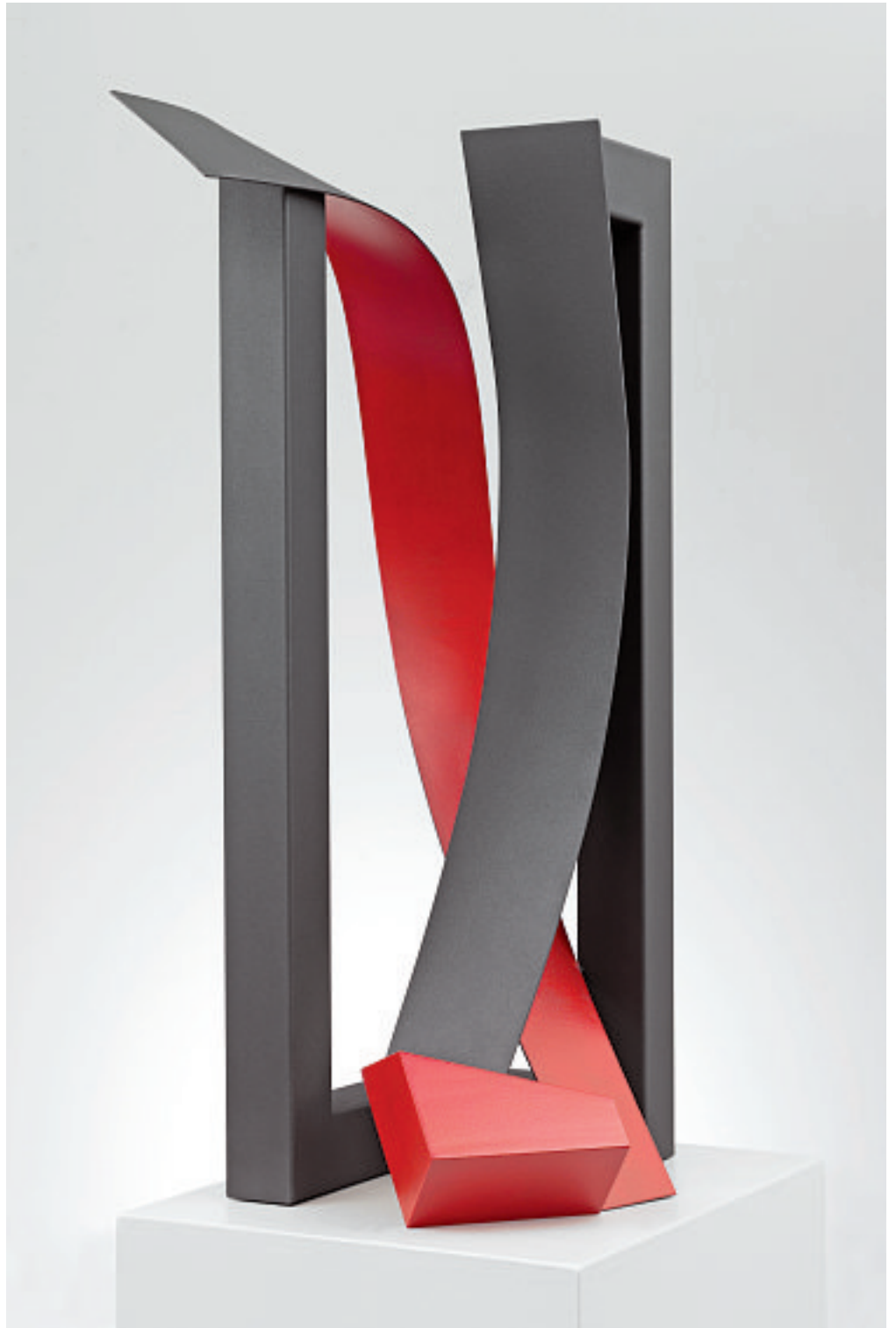
STEP-BETWEEN, 2007 Privatsammlung