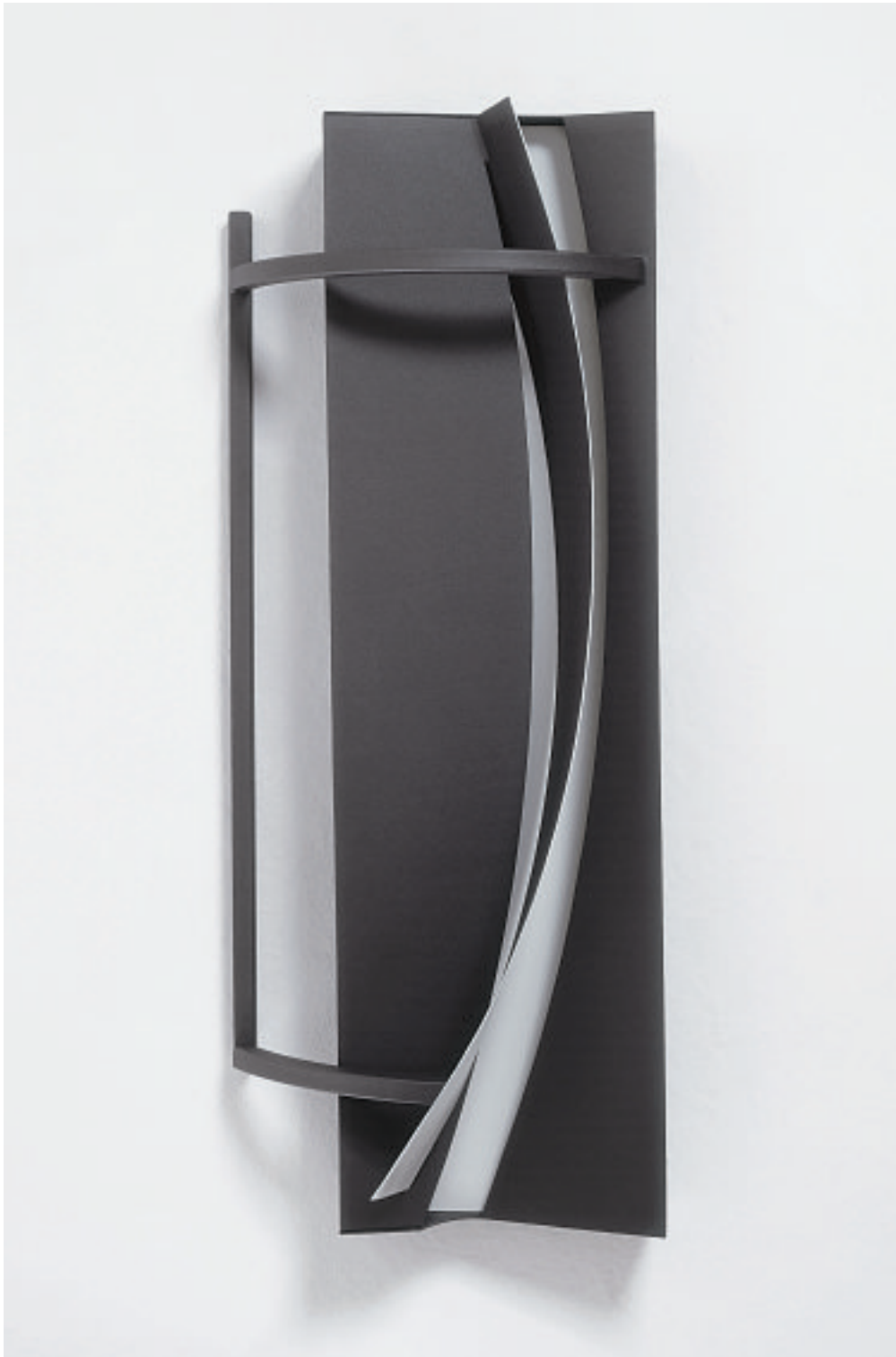
PETITE FLEUR, 2000