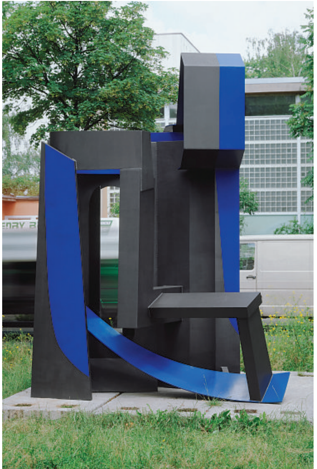
NORTHERN ROMANTIC, 1992